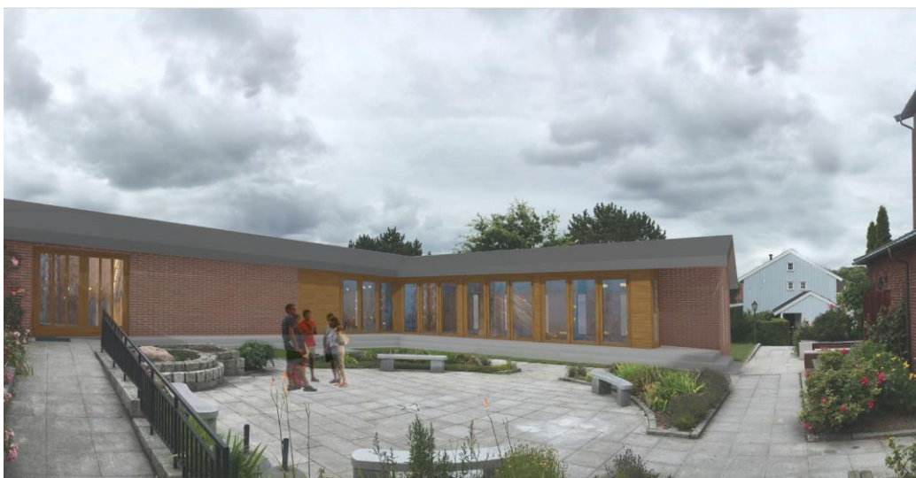
Nybygget med glassdører som kan åpnes mot St. Olavshagen (alle datategninger ved KB arkitekter)